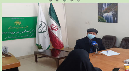
مصاحبه مدیرعامل کانون با واحد مرکزی خبر صدا و سیما ۱۳/۱۱/۹۹

ج- ادامه برنامه های اجرایی مدیریت جامع حوضه آبخیز کرخه